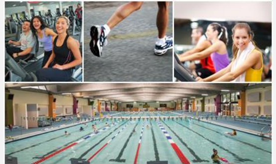
UNSW Fitness & Aquatic Centre

新南威尔士大学有丰富课外活动、社团活动可以供学生们自由参加，除此之外，悉尼的魅力也是不容错过的。