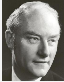
弗朗西斯·克里克 DNA 双螺旋之父之一