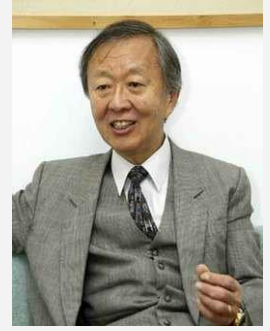
高锟 光纤之父 诺贝尔奖获得者