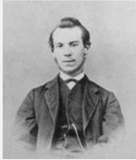
亚历山大·贝尔 电话之父