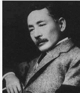
夏目漱石 日本“国民大作家”