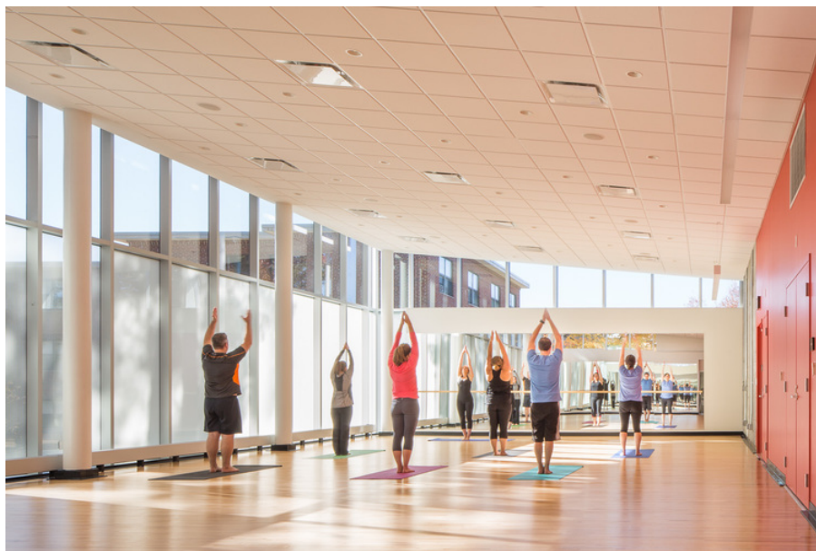
健身中心舞蹈 / 瑜伽室