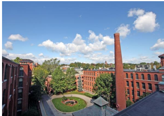
学校周边既有独栋 house 的住房出租，也有公寓式住房出租。